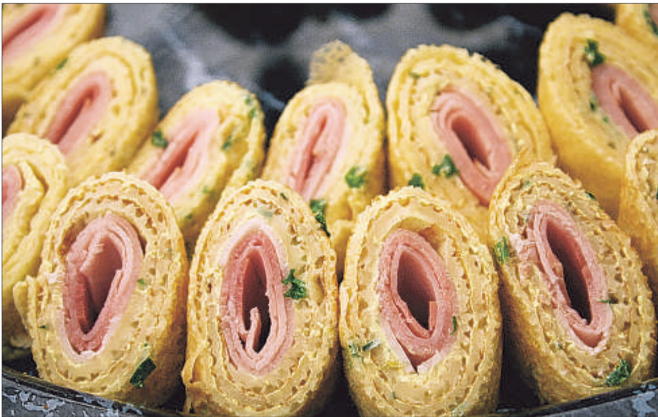
Schinkengipfeli kennen wir alle. Anders ist agriCatering. Ausgefallen, frisch und verblüffend, so kommt der Apéro der Luzerner Bäuerinnen an.